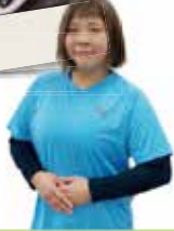
書いた人 山田 彩生