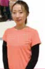
書いた人 竹ノ下 由季